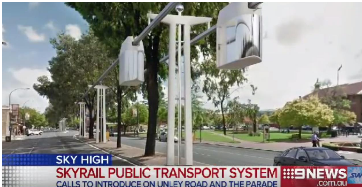
Tekening van de toekomstige Sky Way lijn in Australië, getoond op de Australische televisie

concreet met de aanleg van een lijn in een universiteitsstad is begonnen. Ook andere steden in Australië worden plannen ontwikkeld. De voormalige Australische minister van Verkeer, Rod Hook, heeft dit project vooral gepromoot.